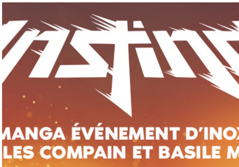
Instinct une histoire d'amis

INOXTAG est un youtubeur très connu à 9,33 M d'abonnés pour 467 vidéos. Il est connu pour avoir tenté l'ascension de l'Everest, il le raconte dans le documentaire Kaizen. Le tome 1 d'Instinct a atteint 150 000 milles ventes en quelques jours pour un premier tirage à 400 000 milles exemplaires, un record pour un premier livre. Instinct 2 sorti le 20 novembre 2025, est sur le point de dépasser le record du premier tome. Il raconte la suite des aventures de Haki, un jeune homme de 19 ans qui a une maladie, un virus appelé le Noctus. Ce manga a été mis en