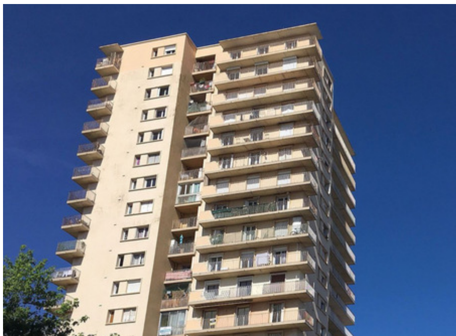
La Tour Saint-Martin - Photo France 3 © C. Monteil.

Cet évènement s'est produit lors de la nuit du jeudi au vendredi vers environ 2h30 du matin. Les policiers et les pompiers sont venus frapper à la porte de mon appartement, et toute ma famille s'est réveillée en sursaut. Moi quand on m'a réveillée, je ne comprenais rien, je pensais que c'était l'heure de faire la prière. C'est une copine de ma sœur qui nous a avertis. Il nous ont dit qu'il fallait vite sortir car il y avait le feu. Nous on habite au quinzième étage. On était obligé de descendre à pieds. Les pompiers nous disent