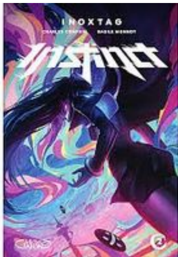
VOICI LE TOME 2