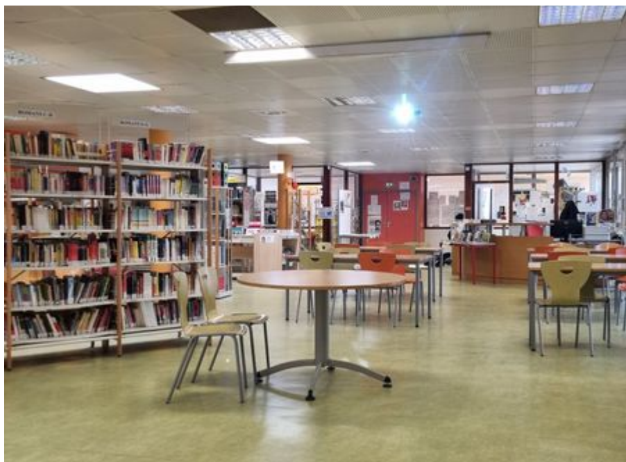
Le CDI du collège Gérard Philipe

4) Pourquoi avez-vous choisi ce métier ? Pour partager ma passion des livres et aider les adolescents à faire face à toutes les nouvelles problématiques de fausses informations, d'esprit critique et d'intelligence artificielle.