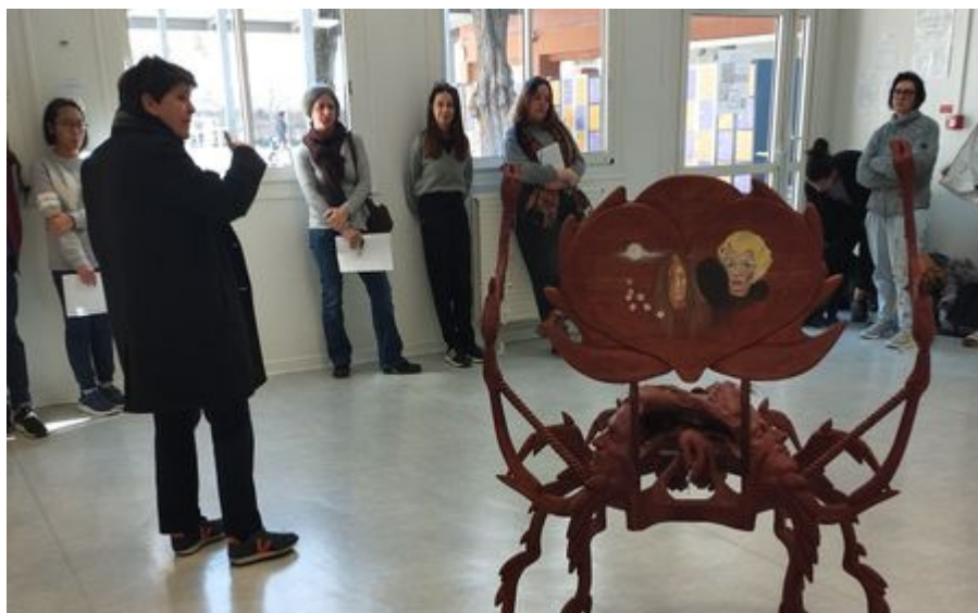
Vernissage de la dernière exposition à la galerie du collège