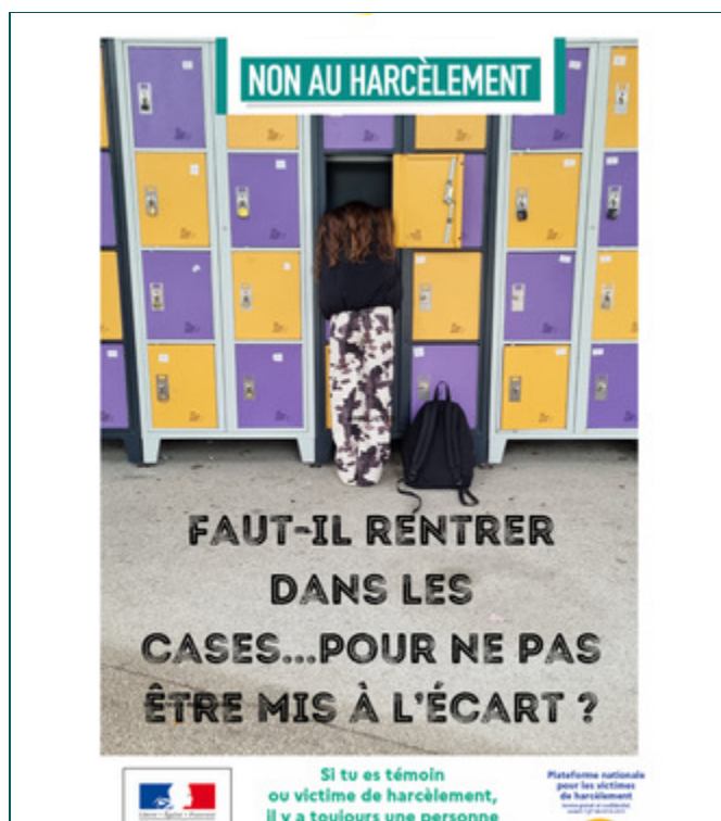
l'affiche du collège coup de coeur académique